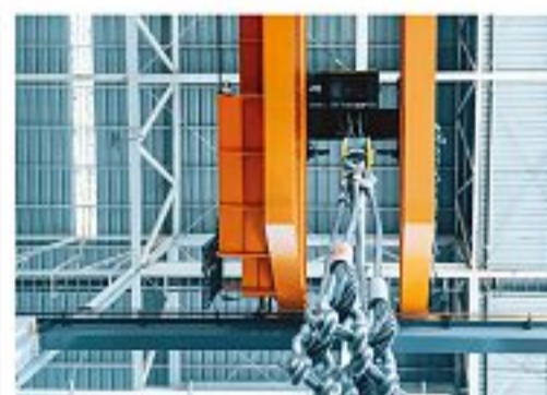
L'operazione Una tra le più frequenti in edilizia

Per sollevare il carico in sicurezza è bene valutarne con attenzione le dimensioni, il peso e il baricentro