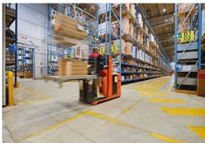
Leader di settore Qualità e innovazione sono da sempre nel dna di Piazzalunga