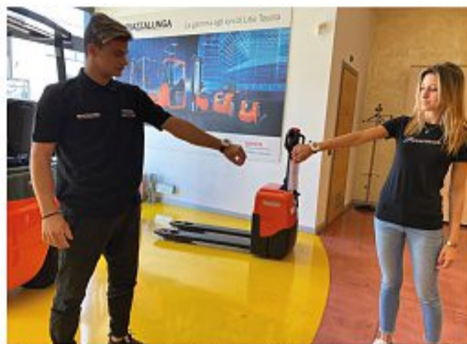
Soluzione smart Un prodotto all'avanguardia per il distanziamento sociale

Il funzionamento di Dista Safe è tanto semplice quanto efficace. Si tratta di un bracciale che,