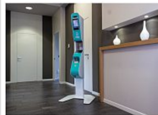
Modello total A tutela dei lavoratori

L'obiettivo L'utilizzo del macchinario consente di combattere i contagi da Covid-19